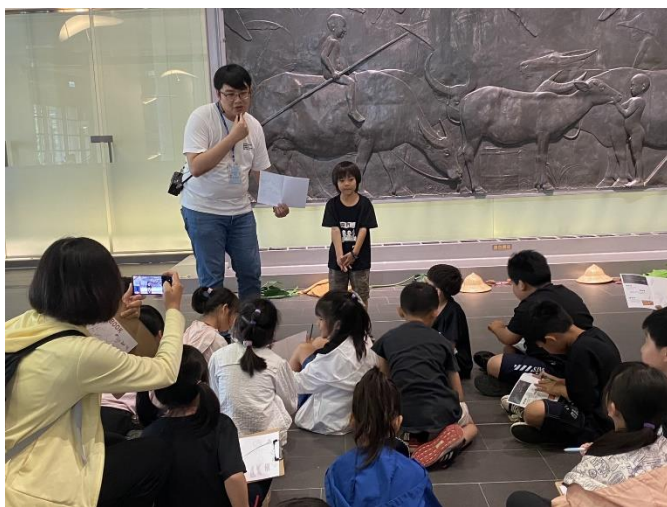
說明:介紹美術作品