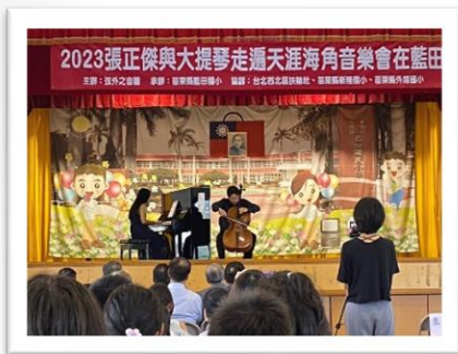
張正傑大提琴家音樂會