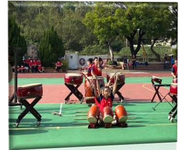
苗栗縣音樂賽榮獲優等