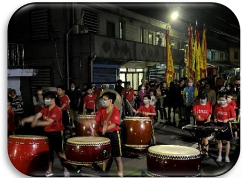
地方活動-天佑宮表演