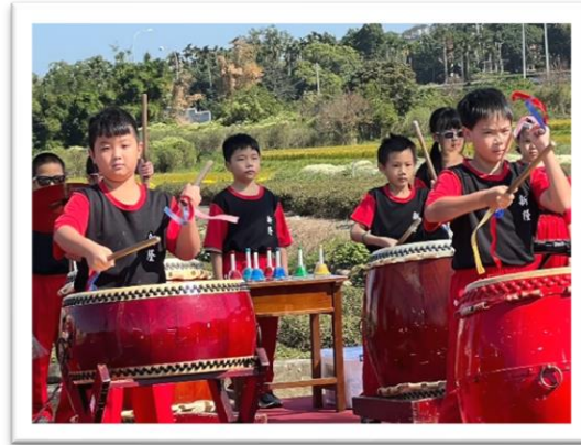
銅鑼杭菊生活節演出