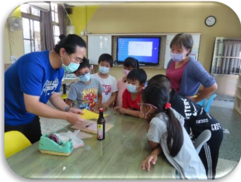
製版要注意的事項