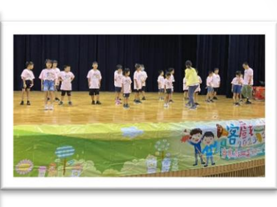
榮興客家採茶劇團-客戲一夏