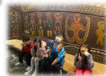
九族 賞櫻 原民 文化 之旅