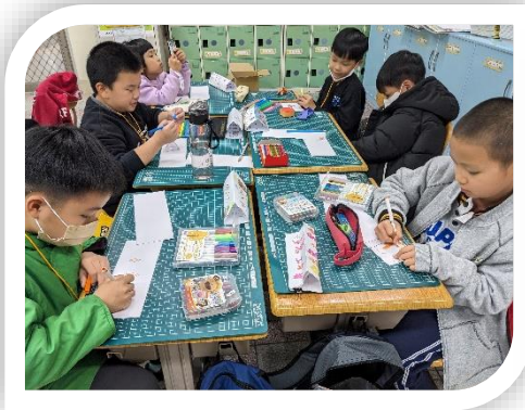
清華大學-創意名牌