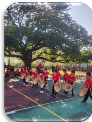
學校暨社區健行活動表演