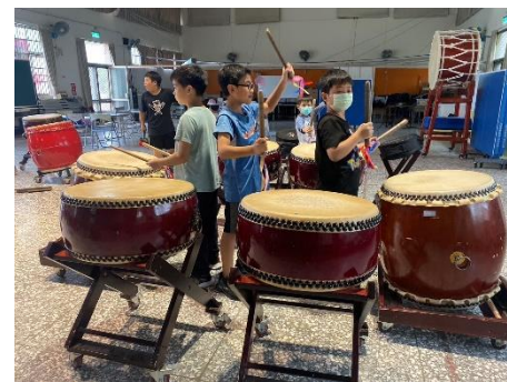
節令鼓練習不間斷