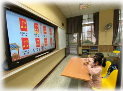
節奏結合數位學習