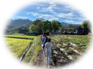
在大自然中感受美的喜悅