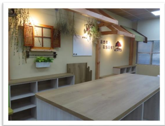
圖書室的藝術洗禮