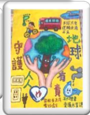
繪畫比賽 表現優異